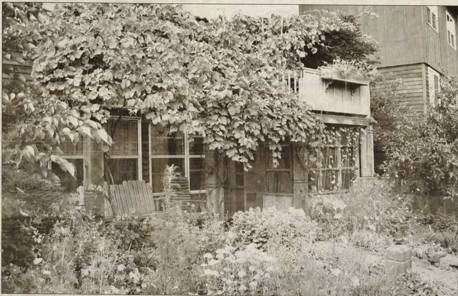
Plusieurs habitations communautaires ont leur coin vert, un refuge propice à la détente.